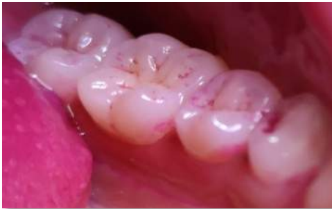
Permukaan Oklusal & Lingual